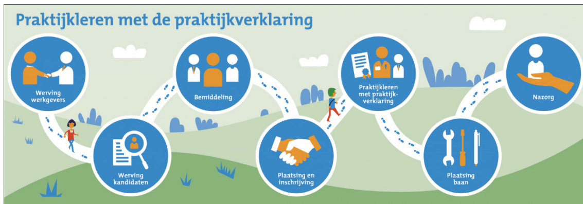
Figuur 1 – Processtappen praktijkleren met praktijkverklaring

In het figuur zijn de processtappen beschreven die samenwerkingsverbanden in een arbeidsmarktregio (voor werkzoekenden) moeten doorlopen voor het realiseren van 'Praktijkleren met de praktijkverklaring'. 7